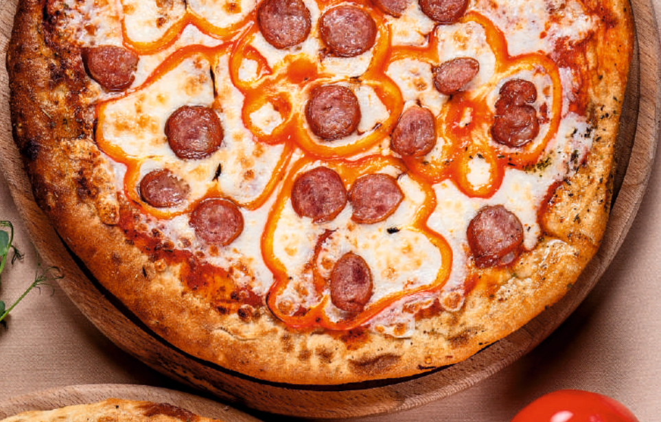
Пицца с баварскими колбасками